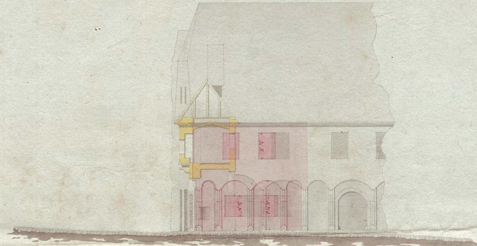
Längenschnitt nach der Linie C-D.