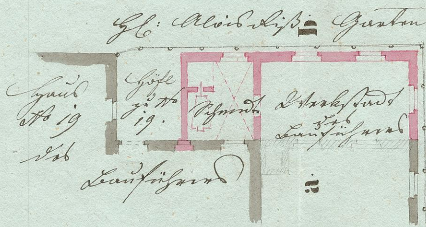
Grundriß zur ebenen Erde